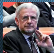
Giorgio Agagliati Comunicazione interna Intesa Sanpaolo Il binomio vincente dell'informazione aziendale